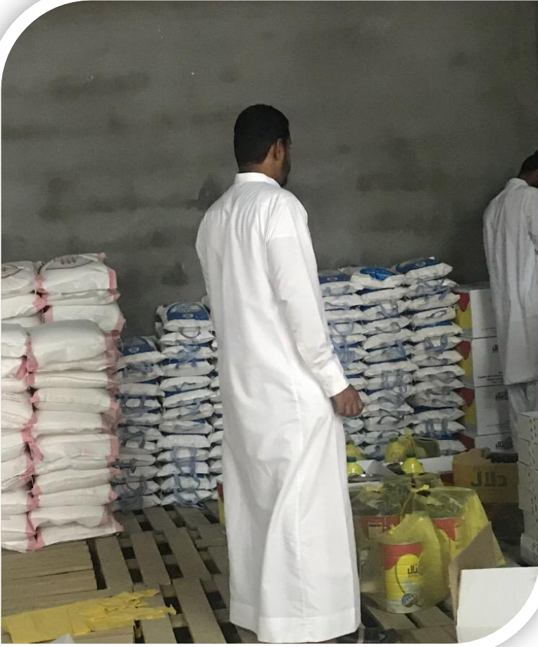
جزء من المواد الغذائية الواردة