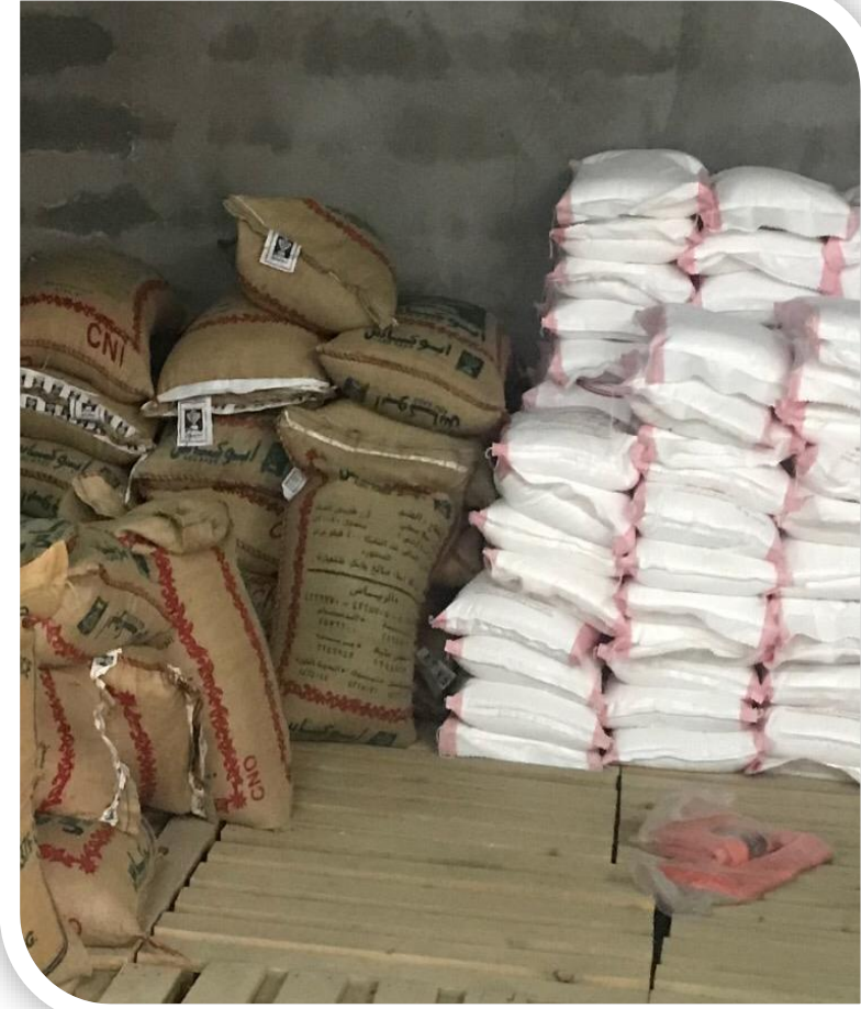
جزء من صور مكونات السلة والمواد الغذائية الاخرى